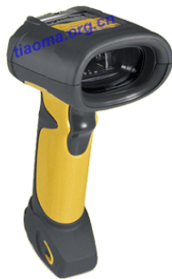
手持 工业级耐用型条码扫描器