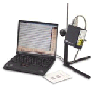
HHP QC OLV条形码检测仪

采用先进的数字信号处理（DSP）技术， 可保证快速处理、高速打印和精确分析， 带有5个可编程输出端口，用于实时控制打印机或传送带， 支持传统与美标检测方式。