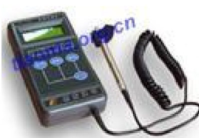
德瑞克DRK125JY条形码检测仪